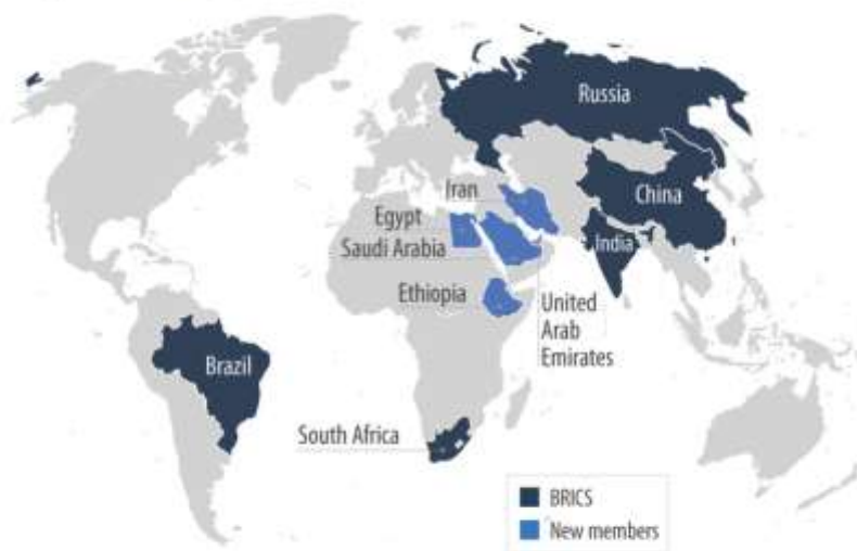
Figure 1 – BRICS+